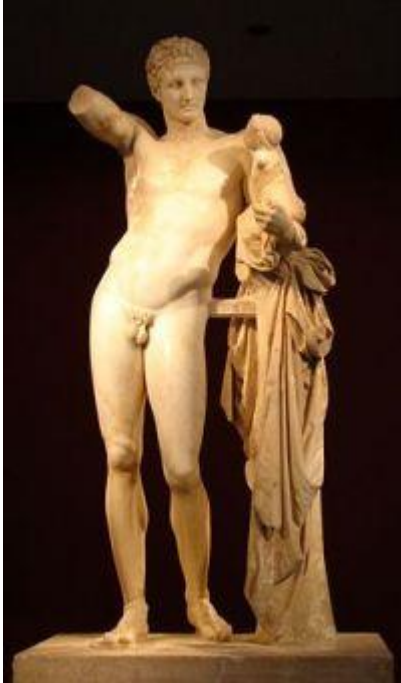
Ermes con Dionisio , opera di Prassitele (conservato al museo di Olimpia)

Zeus , divertito dall'abilità e dalla furbizia del piccolo decise di farlo divenire il suo araldo e ambasciatore personale, accompagnatore dei morti nell'Ade , oltre che protettore dei...ladri!